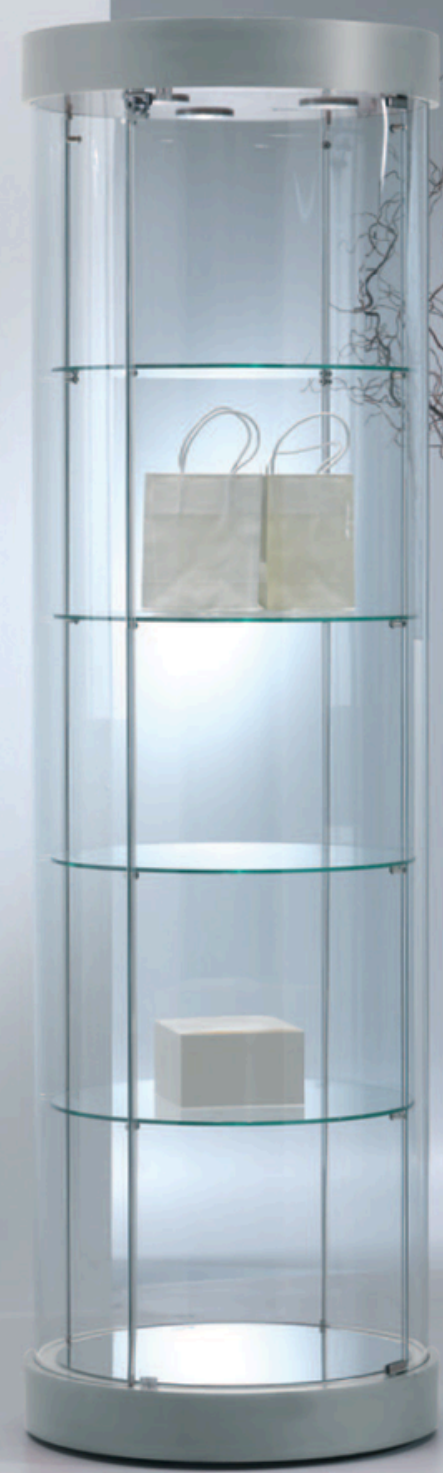
art. 209/RFVA (cm Ø56x190h) art. 209/R7VA (cm Ø71x190h)