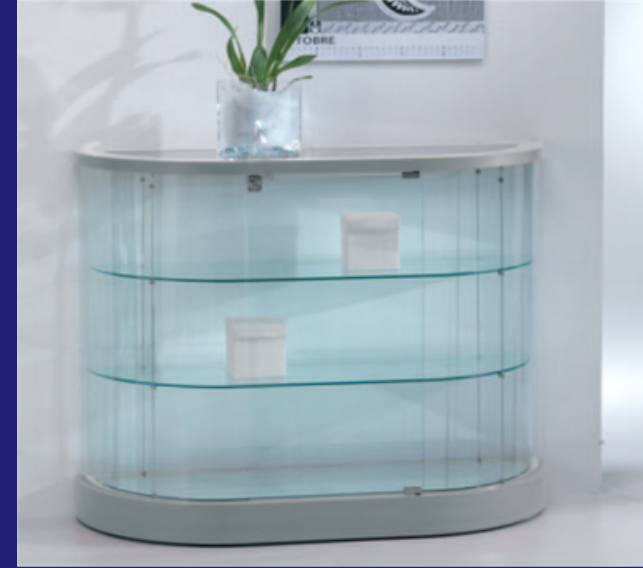
EXEMPLE D'ART. 209/MBVA CONTRE LE MUR.

LES VITRINES DE LA GAMME TOPLINE SONT RÉALISÉES EN VERRE TREMPÉ.