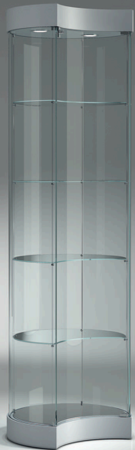
art. 209/MLVA (cm Ø57x190h)