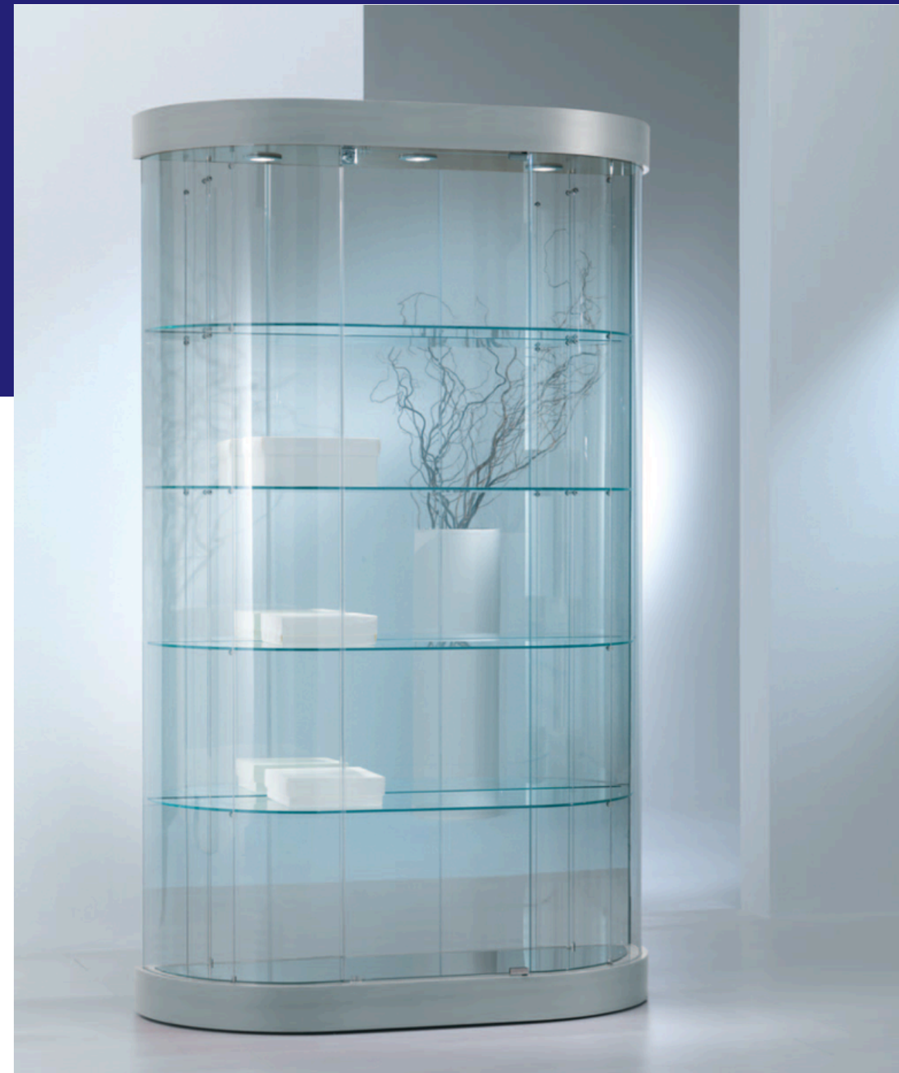
art. 209/MVA (cm 112x38x190h)