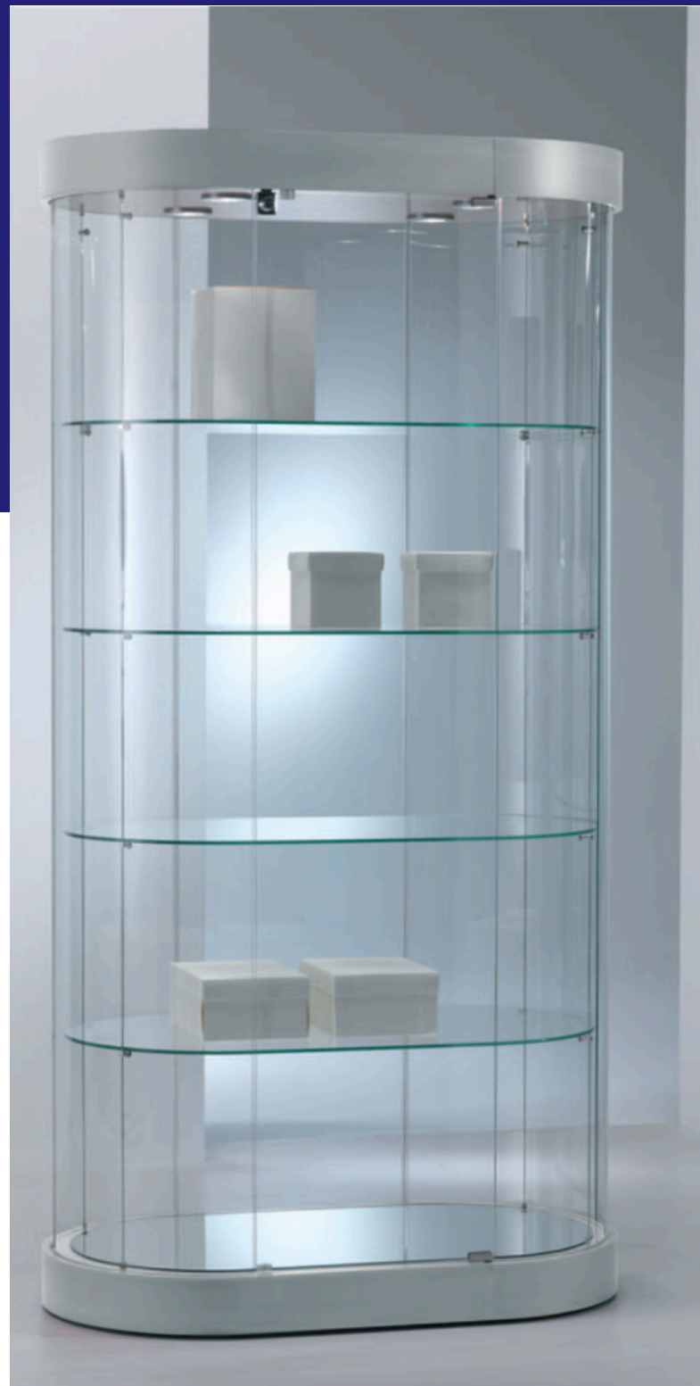
art. 209/OGVA (cm 97x56x190h)