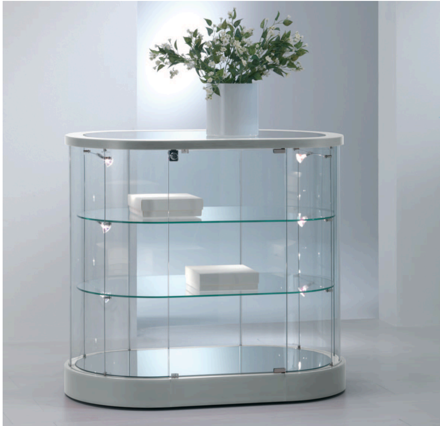
» 420 _ art. 209/OBVA (cm 96x56x87h)