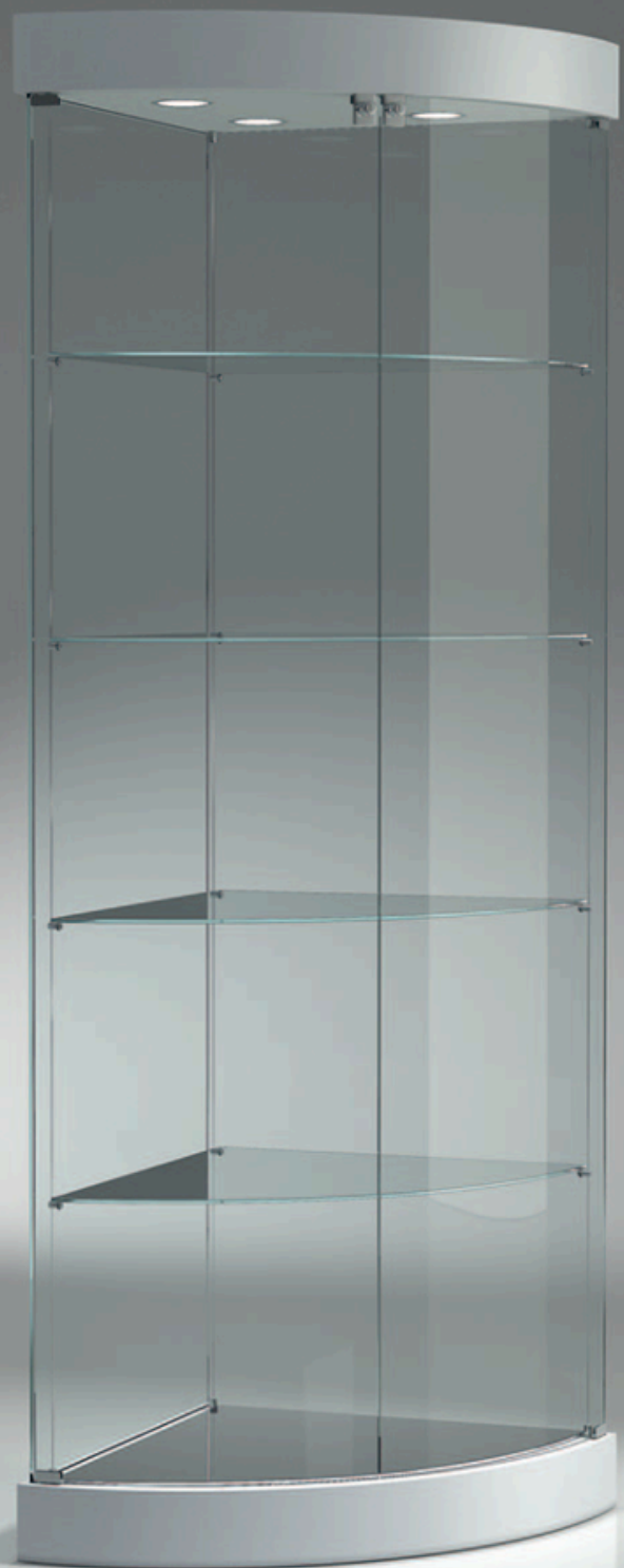
art. 209/ANVA (cm 58x58x190h)