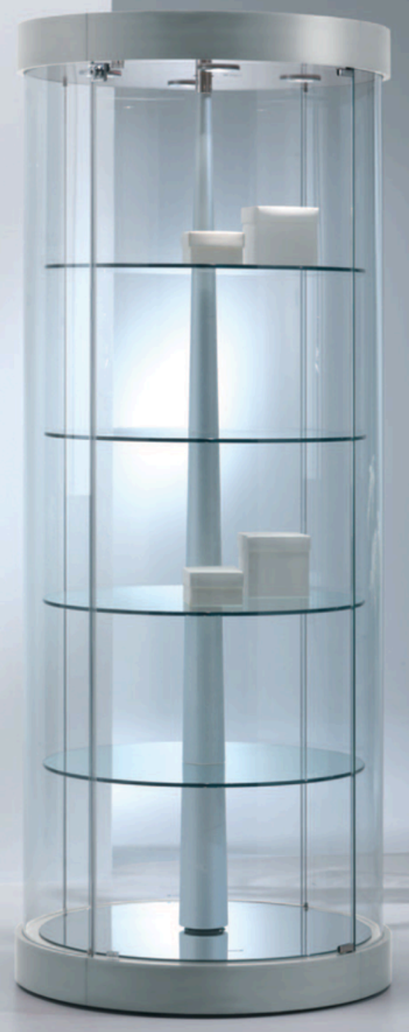
art. 209/RGVA (cm Ø71x190h) Pour des étagères réglables en hauteur.