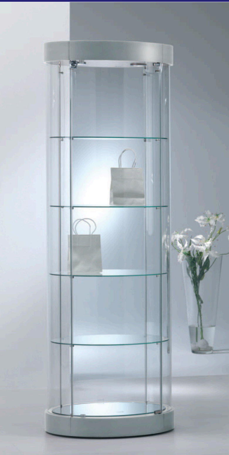
art. 209/OPVA (cm 64x44x190h)