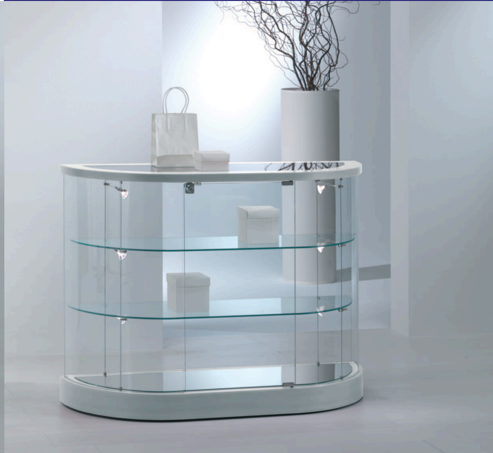
art. 209/MBVA (cm 112x38x87h)